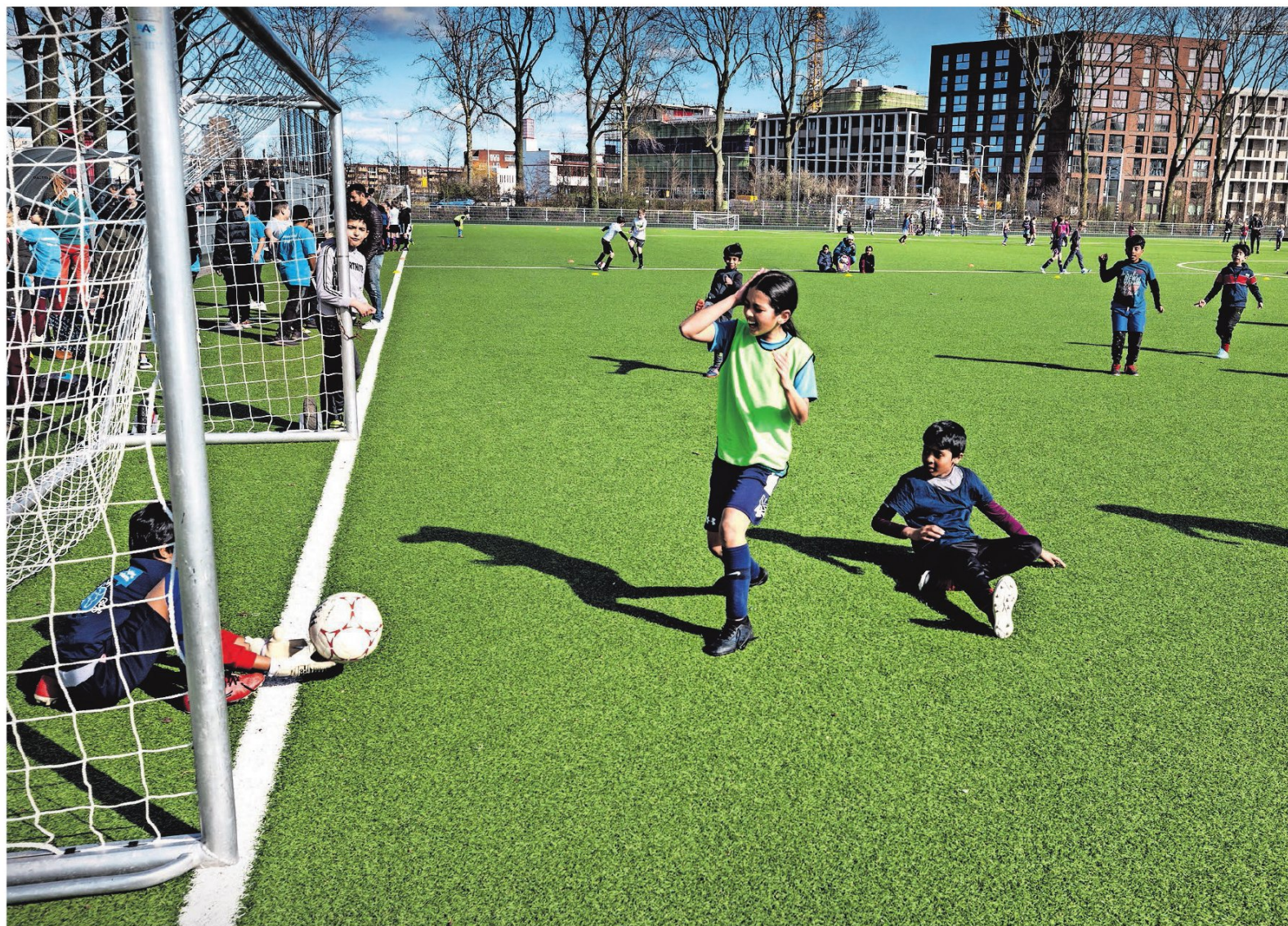
Schoolvoetbaltoernooi in Utrecht bij een basisschool.